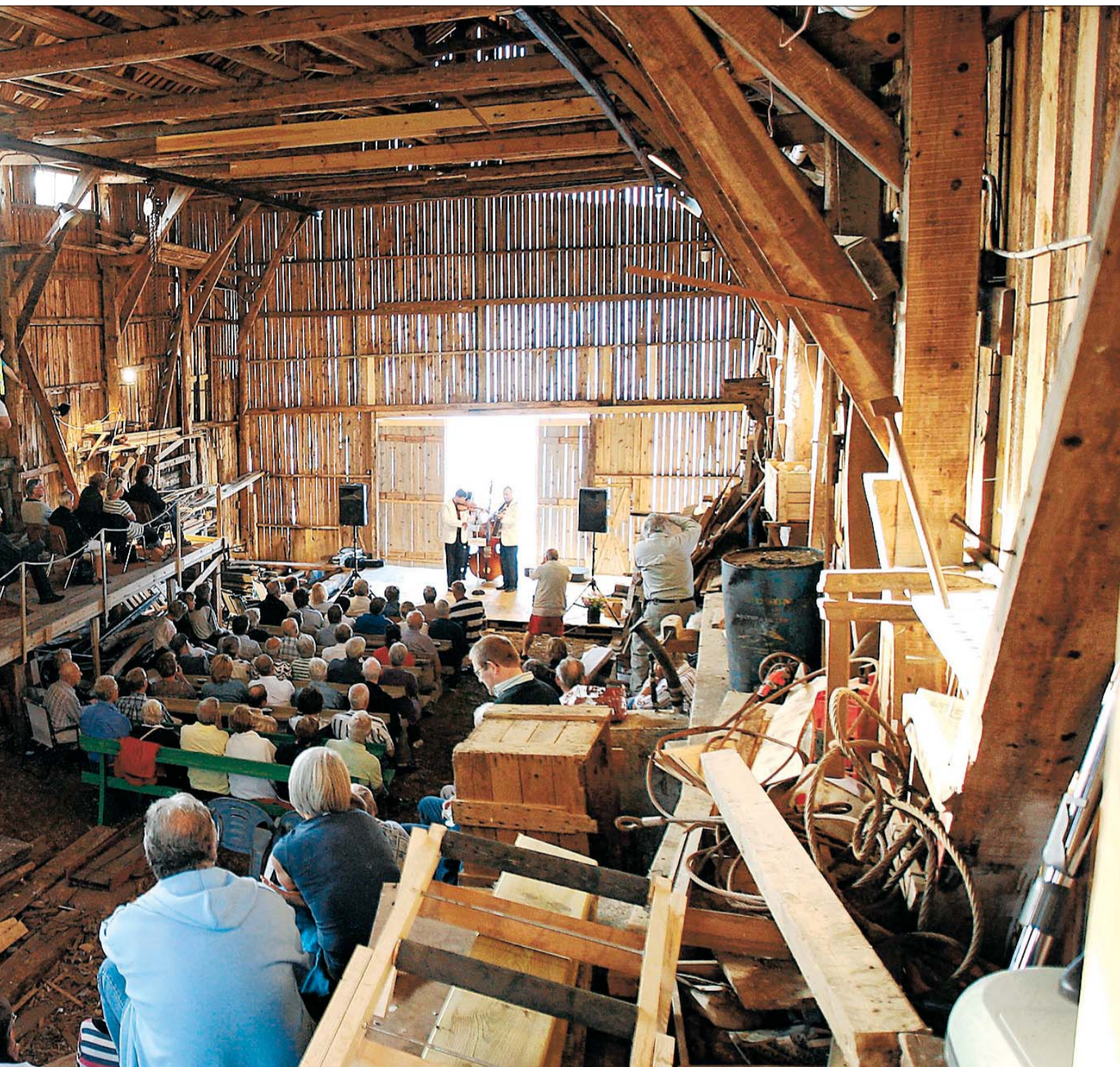
de hadde hatt slik musikk til arbeidet. 150 tilhørere koste seg med bluegrass-musikk på Moen utenfor Risør.