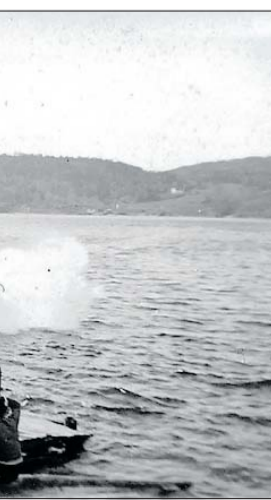
ved K. Christensen &amp; Co, elmsen som går i sjøen.