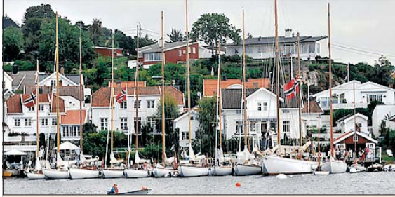
KLARE FOR SEILAS: Samling i Grimstad havn. Gjør seg klar til å være med på Trebåtfestivalen i Risør.