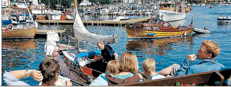
VENTER: Folk i Risør ser småbåtene komme til byen for å delta i festivalen.